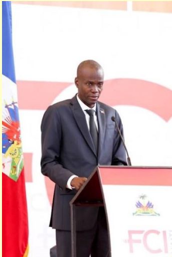
Discours de clôture Son Excellence M. Jovenel MOISE Président de la République