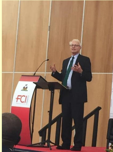
Mr Michael PORTER

Professeur Bishop William Lawrence à la Harvard Business School. Il est l'un des experts les plus reconnus et respectés dans les domaines de la stratégie d'entreprise et de la compétitivité des pays et des régions. Michael Porter a travaillé avec de nombreux gouvernements, grandes entreprises et groupes académiques à travers le monde. Il préside le programme de la Harvard Business School destiné aux nouveaux PDG d'entreprises. Il a décrit le modèle des Cinq Forces de Porter dans son premier article de la prestigieuse Harvard Business Review paru en 1979, et intitulé « How Competitive Forces Shape Strategy ».