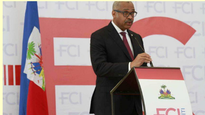
Discours d'ouverture Son Excellence M. Jack Guy LAFONTANT Premier Ministre de la République d'Haïti